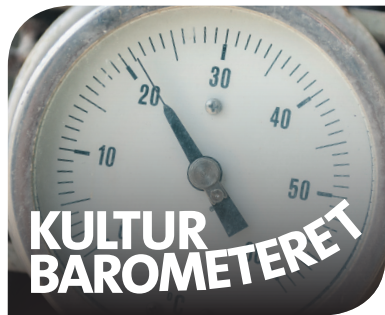
I Herning Folkeblads serie »Kulturbarometeret« tager vi temperaturen

To horisontale plader står adskilt fra hinanden via facadestykker, som danner zigzag hele vejen rundt om bygningen og har en væg af glas bag