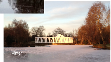
Dec. eftermiddag med sne