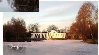
Dec. eftermiddag med sne